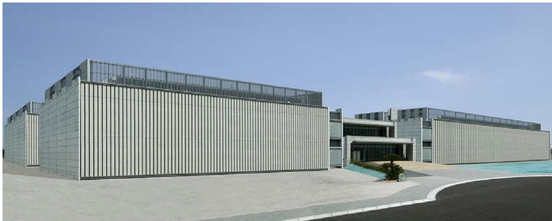
アジアン・フロンティア 4号棟完成予想図（写真左側）

現在建設中で2011年9月末に竣工予定の3号棟に加え、新たに4号棟を建設することで、急増する災害対策需要に対応すると共に、Yahoo! JAPAN グループのインターネット事業におけるインフラ基盤強化とクラウドコンピューティングサービス「NOAH（ノア）」の西日本拠点として展開してまいります。